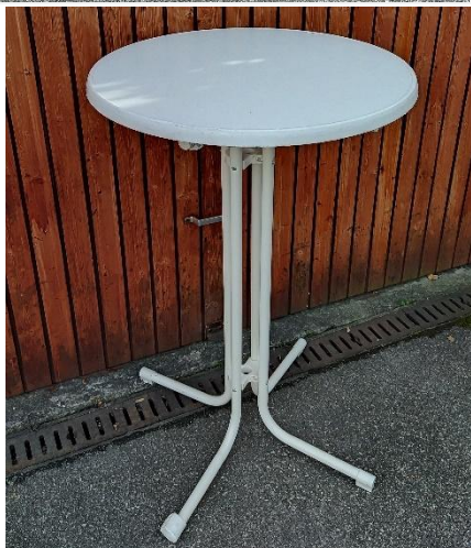
Steh- oder Bistrotische – Anzahl: jeweils 5