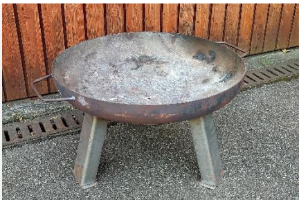
Feuerschale (Durchmesser: 55cm)