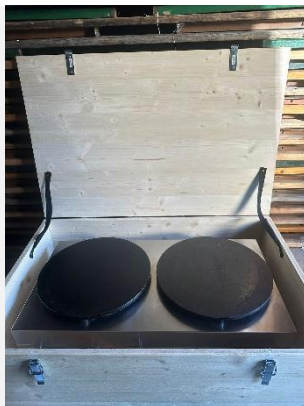
Crêpes-Platten (mit Gas betrieben) In Holzkiste für Transport

30€ pro Tag / + 50€ Reinigungsgebühr, wenn sie nicht sauber zurück kommt