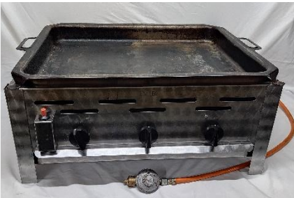
Bräter (mit Gas betrieben)

10€ / pro Tag 20€ / pro Tag + 50€ + 50€ Reinigungsgebühr, Reinigungsgebühr, wenn er nicht wenn er nicht sauber zurück sauber zurück kommt kommt