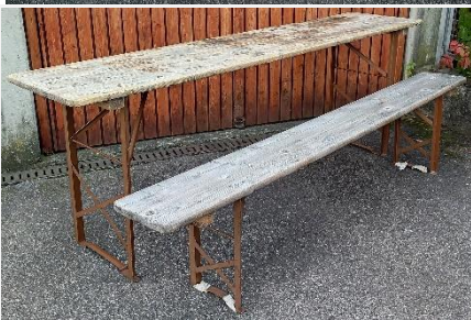
Biertischgarnituren (1x Biertisch 2,2m x 0,49m + 2x Bierbank 2,2m x 0,24m) - Anzahl: 10

Hinweis: Unsere Biertischgarnituren haben schon so einige Freizeiten und Aktionen begleitet. Einige Gebrauchsspuren sind ersichtlich.