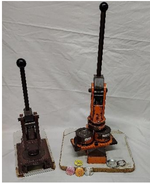
Buttonmaschine (für große bzw. kleine Buttons)