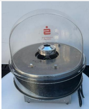
Zuckerwatte-Maschine In Holzkiste für Transport

30€ pro Tag / + 50€ Reinigungsgebühr, wenn sie nicht sauber zurück kommt